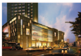
Centros de Negocios